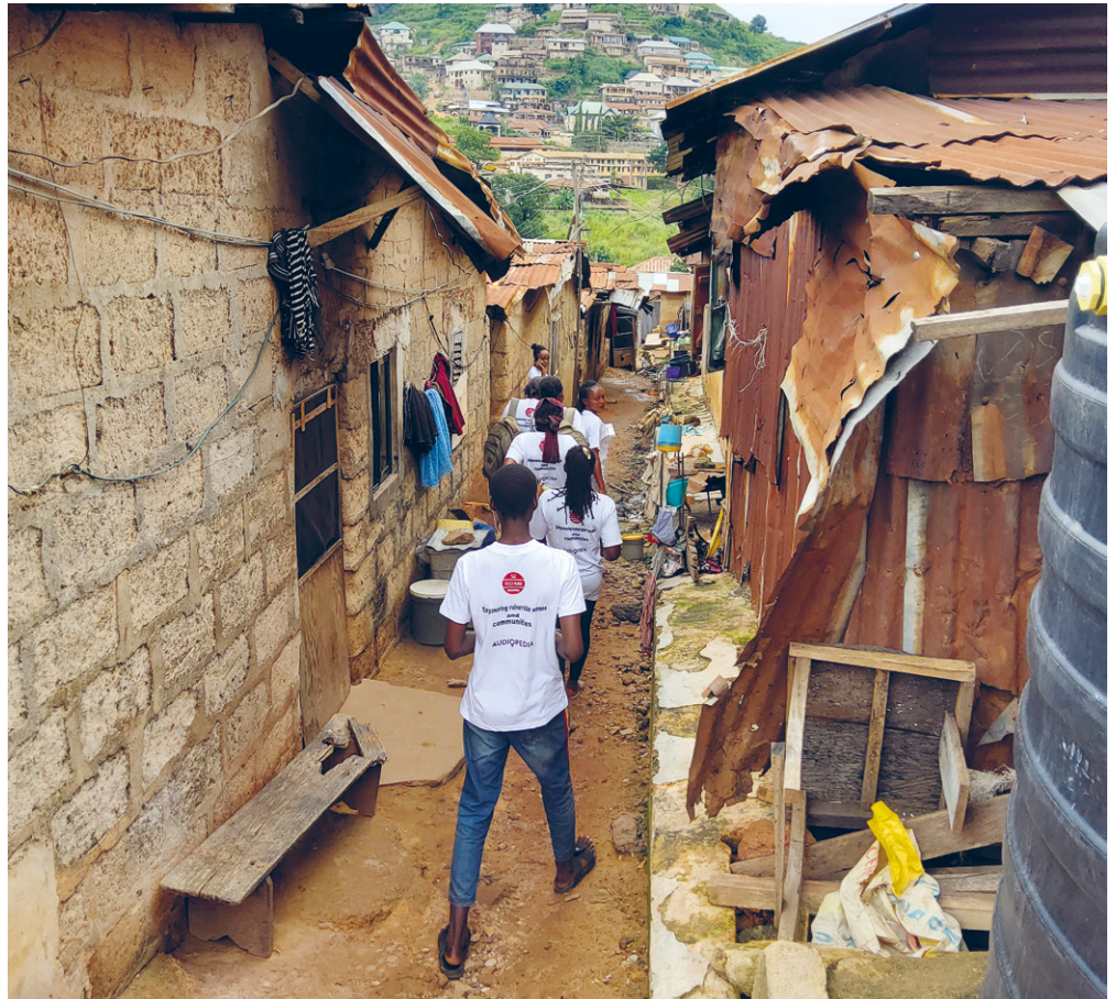
Das Team bringt die Informationen zu den Menschen.

Gesund zu sein, ist eine Grundvoraussetzung, um ein erfülltes, selbstbestimmtes Leben zu führen. Bitte unterstützen Sie mit Ihrer Spende den Ausbau dieser Programme zur Gesundheitsaufklärung.