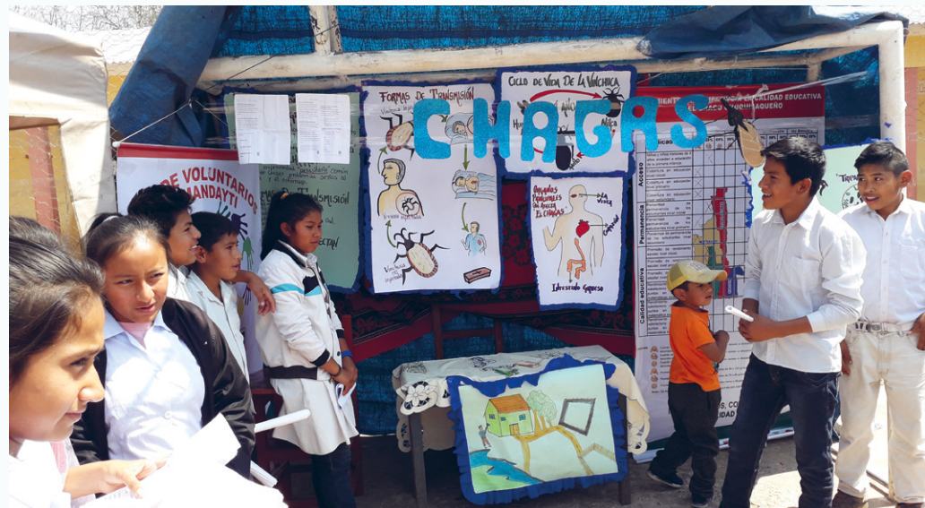
Die Schülerinnen und Schüler sind mit Interesse dabei.

Wissensvermittlung einbinden, um möglichst viele Kinder zu erreichen. Sie werden zu Multiplikatoren, indem sie ihr Wissen über die Gefahren, die von den Raubwanzen und einer Chagas-Erkrankung ausgehen, mit nach Hause nehmen und an ihre Eltern weitergeben.