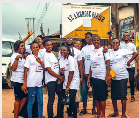
Die Mitarbeitenden sind mit Begeisterung bei der Sache.

Digitale Kommunikationstechnologien haben hier großes Potenzial, Wissenslücken zu schließen. Doch wer nicht lesen kann, keine der Hauptsprachen eines Landes spricht, keinen Strom