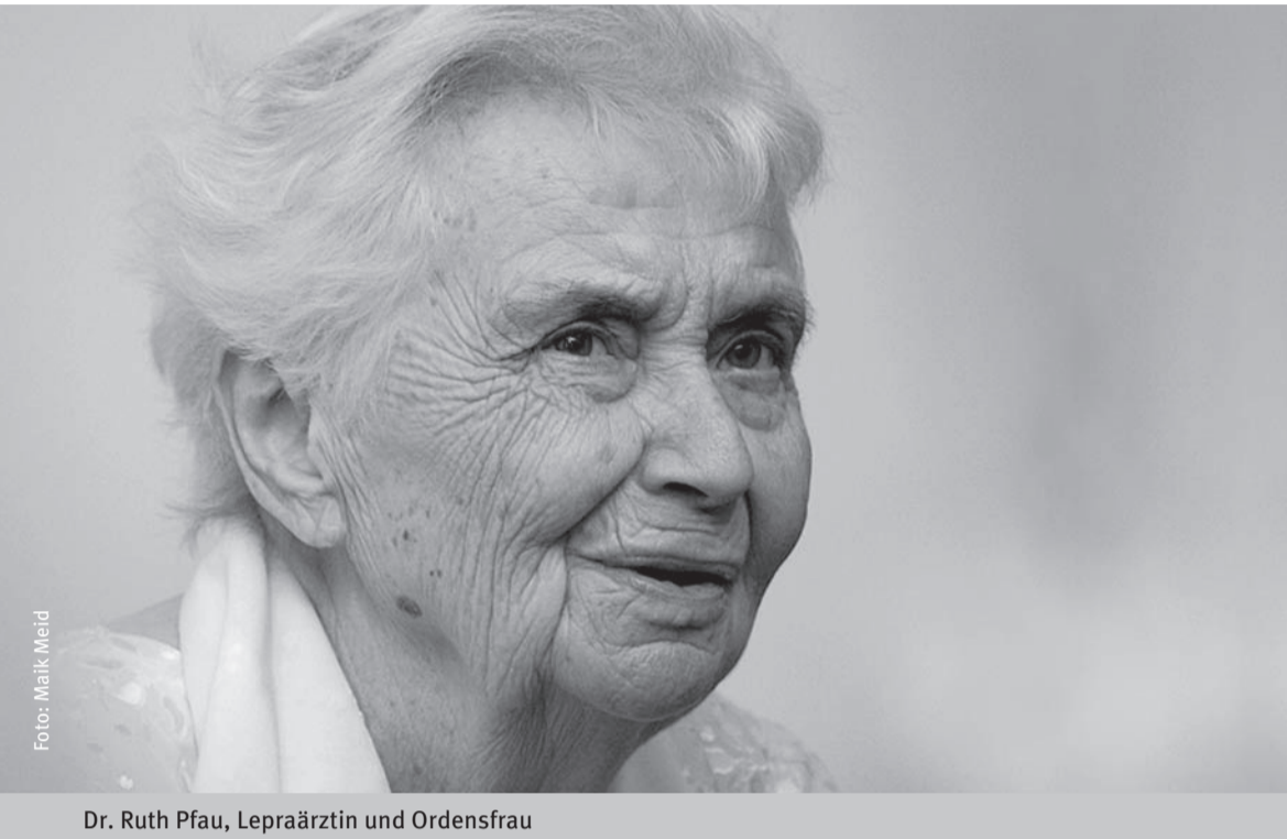
Dr. Ruth Pfau, Lepraärztin und Ordensfrau