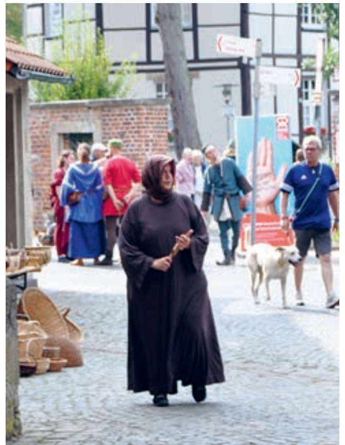
Etwas gruselig wird es für die Besucher an den Kirmesständen, als eine Lepröse aus dem Jahr 1616 mit Lepra-Klapper auftaucht und lautstark mit ihrer Geschichte aufwartet.

Für die Dritte Siechenkirmes, die in zwei Jahren geplant wird, hoffen die Veranstalter auf größeres Publikumsinteresse und weniger konkurrierende Veranstaltungen; an diesem Wochenende hatte als Publikumsmagnet der lokale Rundfunksender mit seinem 25-jährigen Jubiläum viel Aufmerksamkeit von Stadtvertretern, Münsteranern und Gästen auf sich gezogen.