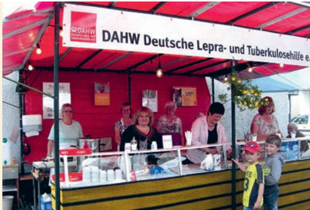
Mit Freude dabei! Waffelbäckerinnen auf der Letmather Kirmes.

Seit über 40 Jahren gehört auch der Waffelstand der DAHW-Aktionsgruppe in Letmathe mit dazu. Für viele Letmather ist es mittlerweile eine lieb gewordene