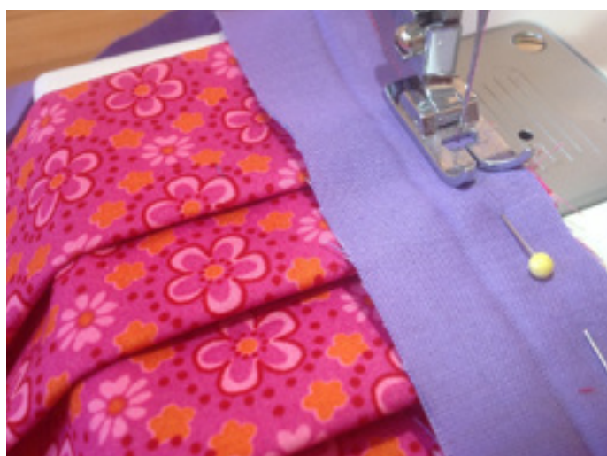
9. Dann auf beiden Seiten an der Maske feststeppen.