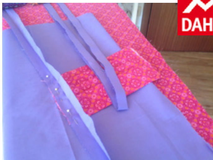
7. Band bündig mit der Außenkante der Maske ca. mittig feststecken.