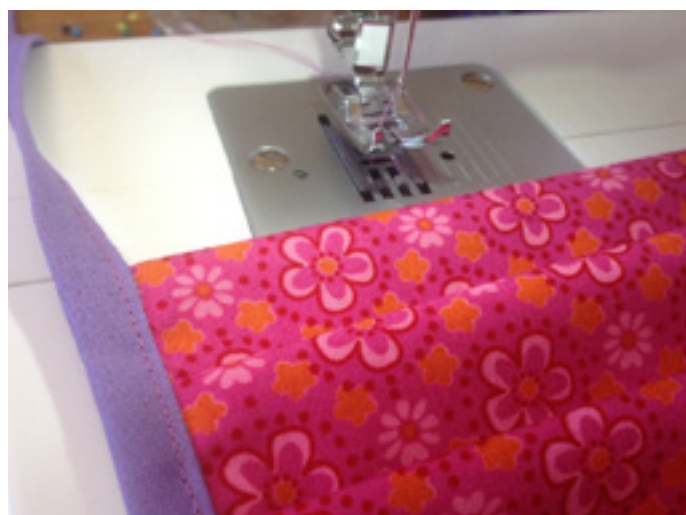
10 b) ... und knappkantig feststeppen.