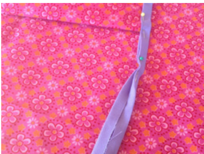
10 a) Nun das restliche Band zur mittleren Bügelfalte hin einschlagen, feststecken ...