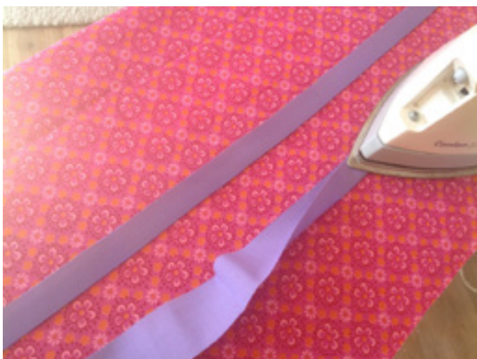
6. Die Bänder zur Hälfte auf 2 x 90 cm umbügeln.