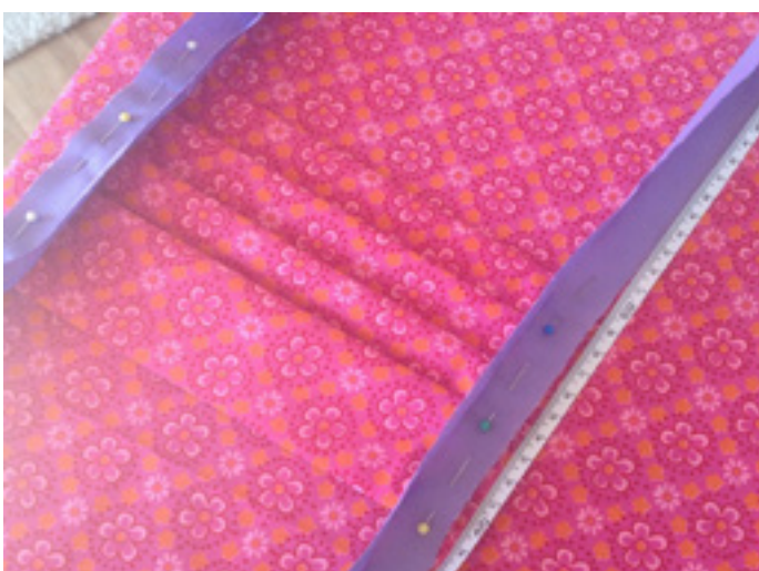
8. Ebenso auf der anderen Seite.