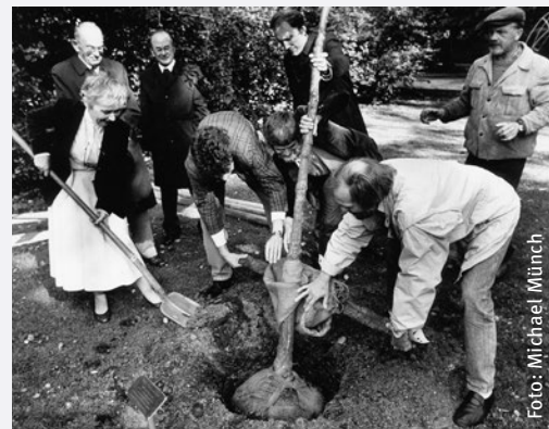
Pflanzung der Siecheneiche in Osnabrück am 2. Oktober 1987.

Als Dr. Ruth Pfau am 1. Oktober 1987 die „Siecheneiche“ auf dem Gelände des ehemaligen Leprosoriums der Stadt Münster einige Meter vor dem Lepramuseum pflanzte, war sie auf einer ihrer vielen Deutschlandreisen unterwegs. Über Jahrzehnte hat sie fast jährlich ihre zahlreichen Unterstützerinnen und Unterstützer durch ihre Berichte beflügelt, weiter die notwendigen Spenden für die Leprahilfe zusammenzutragen.