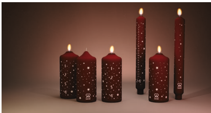
Kerzen als »Licht der Hoffnung« – für Sie zuhause und für kranke Menschen in den Projektländern.

kann, wurde dieser Gedanke für die nächsten Jahre zur Kernidee, mit eigenem Einsatz etwas so Wichtiges bewirken zu können.