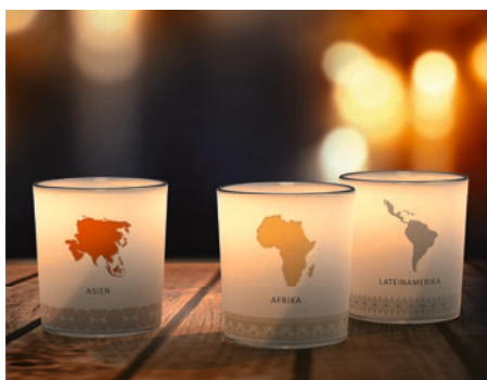
Diese drei Kerzen symbolisieren die Kontinente, in denen die DAHW tätig ist.

In Klasse 5 war Damian de Veuster Unterrichtsthema, deshalb waren die Schüler:innen für diese Aktion sehr gut zu sensibilisieren und zu motivieren. Als ein Schüler erkannte, dass er mit 50 Euro Erlös ein Menschenleben retten