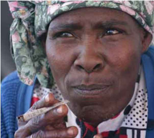
Auch Rauchen erhöht das Tuberkulose-Risiko.

sistenzen entstehen. Die Weltgesundheitsorganisation WHO hat daher schon in den 1970er Jahren die Behandlungsstrategie DOTS entwickelt und sie weltweit etabliert. Die Abkürzung steht für Directly Observed Treatment Short Course und meint eine von medizinischem Personal überwachte Einnahme der Medikamente und kontinuierliche Begleitung der Therapie, eine Kontrolle des Therapieerfolgs und unterstützende Maßnahmen für die Betroffenen. Neuerdings werden auch virtuell-überwachte Therapieschemata in Pilotprojekten getestet, bei denen die PatientInnen durch Smartphones, Tablets oder Computer mit den behandelnden medizinischen Fachkräften vernetzt sind.