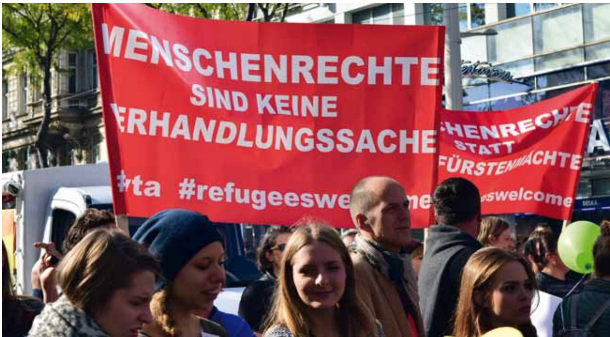
Eine gute Gesundheitsversorgung für Geflüchtete ist essenziell.

dem zivilgesellschaftlichen Akteur ist dabei jeweils ein bestimmter inhaltlicher Schwerpunkt zugeordnet. Die Schüler_innen dieser Arbeitsgruppe lesen also unterschiedliche Texte zum thematischen Hintergrund ihrer Rolle (Elemente G-6 bis -9). In den Arbeitsgruppen, die die Rollen von wirtschaftlichen/wissenschaftlichen und politischen Akteuren (G-11 bis -14 bzw. G-16 bis -19) übernehmen, lesen alle Beteiligten jeweils denselben themenbezogenen Text (G-10 bzw. G-15). Anschließend stellen alle Beteiligten ihre Rollen und Aktivitäten vor und beziehen sich dabei auch auf die in Element G-5 erarbeiteten Gesundheitsziele.