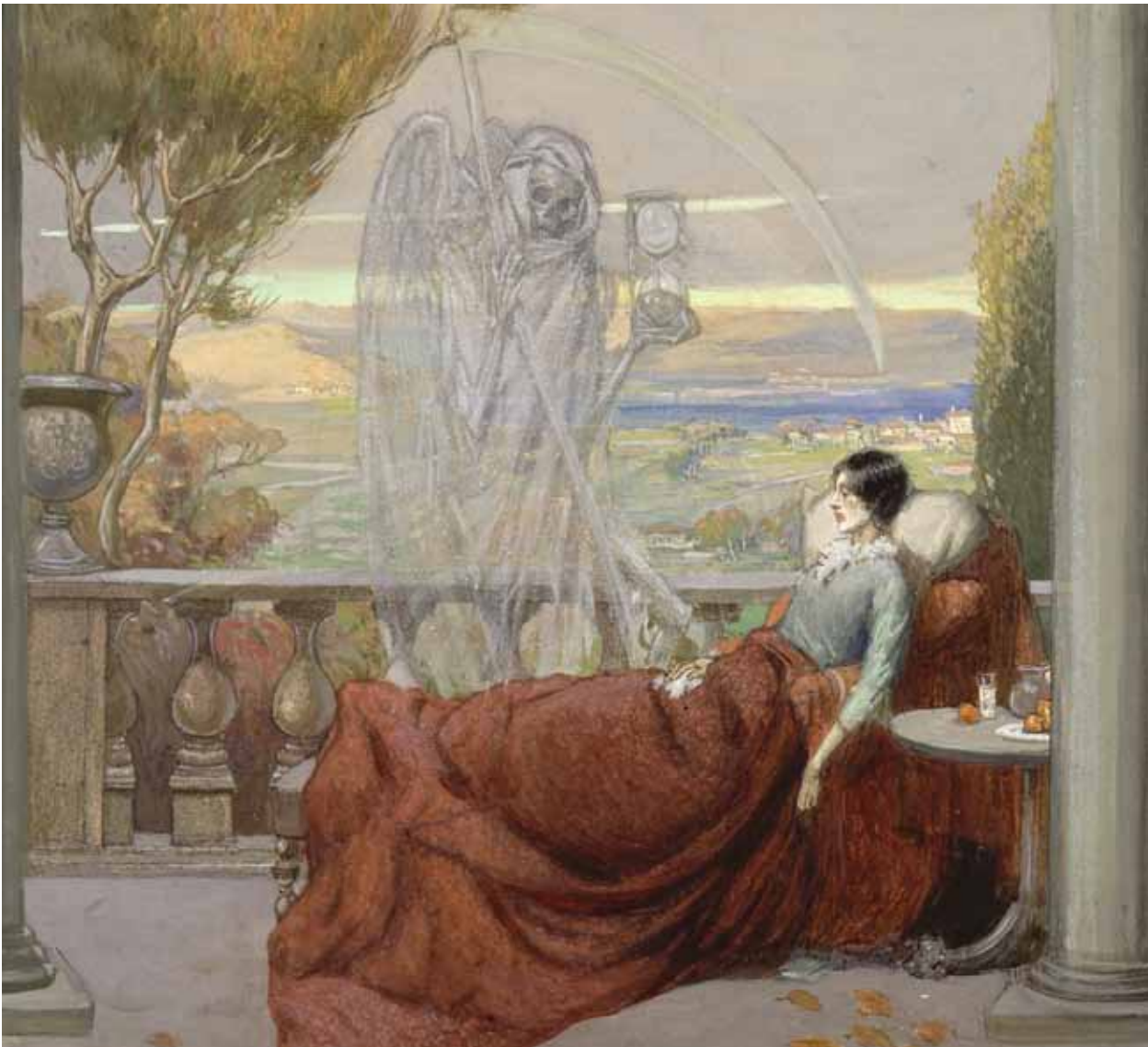
Der Tod am Bett einer TB-Kranken. Gemälde von R.T. Cooper.