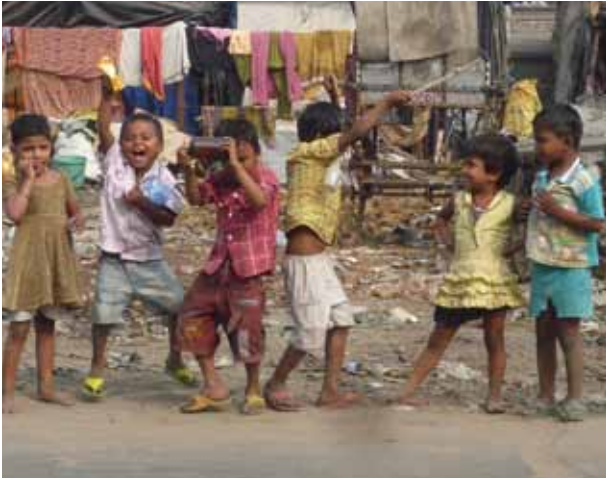
Kinder haben ein besonders hohes Risiko zu erkranken.