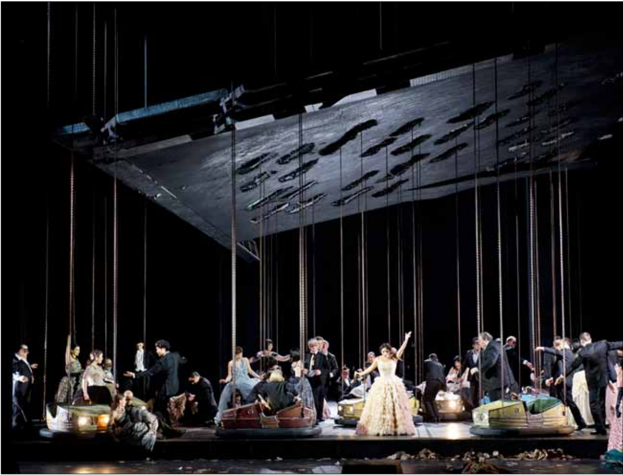
Moderne Inszenierung von La Traviata an der Hamburgischen Staatsoper 2013.

Deutsche G (Universal) (Originaloper: 1853).