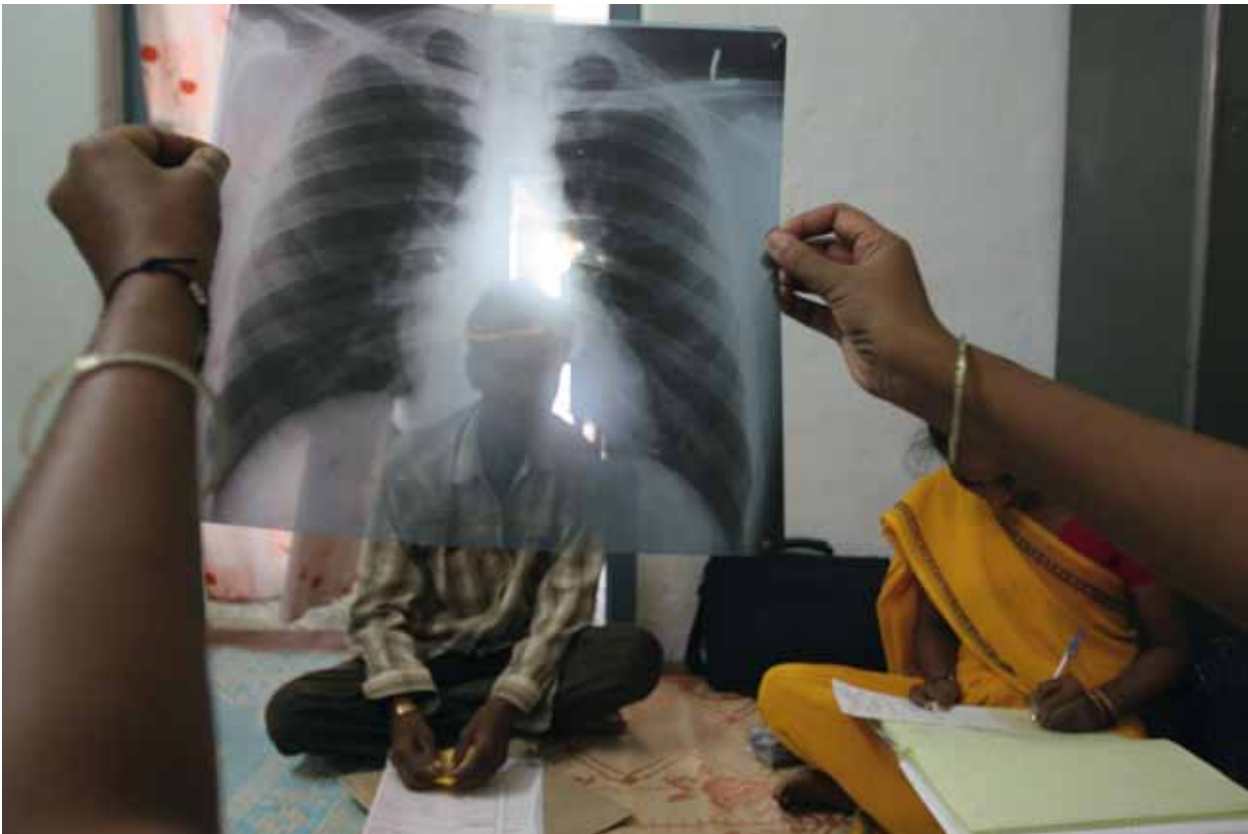
Eine TB-Erkrankung kann durch Röntgen-(Thorax) Aufnahmen diagnostiziert werden.