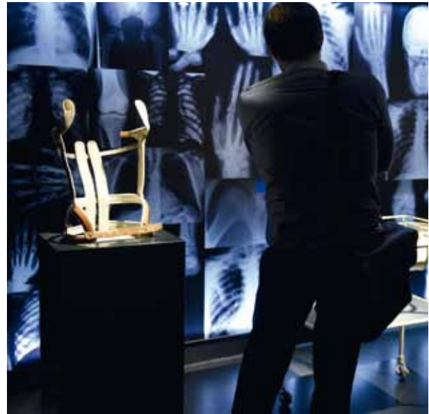
Eine Ausstellung zu Thomas Manns Roman „Der Zauberberg“ im Literaturhaus München gibt Einblicke in die TB-Behandlung damals und heute.

Die Methodik entspricht den Zielen des Globalen Lernens und der Bewusstseinsbildung. Sie ist handlungsorientiert und betont stark die Partizipation der Schüler_innen. Häufig muss individuell recherchiert, präsentiert und diskutiert werden, ebenso häufig regen die Arbeitsaufträge zur Partner- oder Gruppenarbeit an. Nicht zuletzt das in Modul G enthaltene Rollenspiel zur TB-Politik setzt einen Schwerpunkt auf interaktives Lernen. Um das Thema TB begreifbar und erfahrbar werden zu lassen, machen wir zahlreiche Vorschläge für außerschulische Lernorte und Aktivitäten, die über den üblichen Unterricht hinausgehen: Exkursionen, Film- oder Opernaufführungen, Museums- oder Ausstellungsbesuche. Die Unterrichtsentwürfe regen einen breiten Einsatz vielfältiger Medien an. Die Bandbreite reicht von Websites über Präsentationen (PowerPoint) und Filme bis hin zu Broschüren und Zeitungsartikeln. Auf den Websites der Herausgeber finden Sie sämtliche Arbeitsblätter auch als pdf-Dateien. Zusätzliche Unterrichtsangebote sowie Bildmaterial stehen dort ebenfalls zur Verfügung.