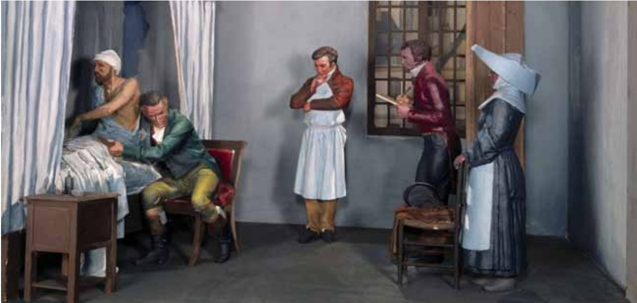
Paris 1816: René Laennec untersucht einen lungenkranken Patienten mit seiner neuen Erfindung, dem Stethoskop.

schen sich mit TB infizieren, daran erkranken oder sterben. Mindestens auf dieses Element muss zu Beginn jedes anderen Moduls als Grundlage verwiesen werden.