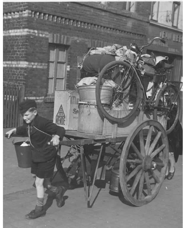
Flucht und Hunger ließen die TB-Rate im zweiten Weltkrieg dramatisch steigen.

zwischen 1876 und 1951. Im Unterrichtsgespräch wird erarbeitet, dass die Sterblichkeit durch TB (ebenso wie die Sterblichkeit durch andere Infektionskrankheiten) schon lange vor Erfindung der Antibiotika kontinuierlich zurückging. Verbesserte Lebensbedingungen und verbesserte Hygiene verbesserten auch die Gesundheit der Bevölkerung erheblich.