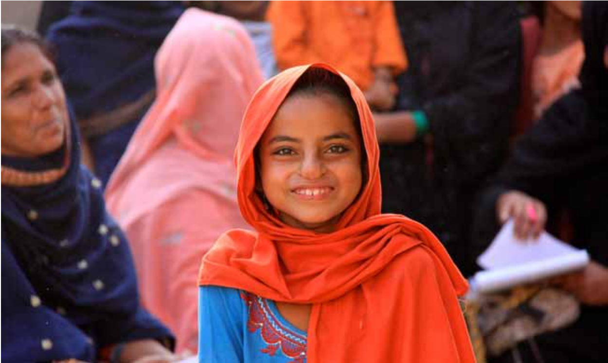
Mädchen und Frauen haben in vielen Ländern deutlich schlechtere Chancen als Männer, dass TB bei ihnen frühzeitig erkannt und behandelt wird.

und Gal. 6, 11-18 verstehen sie, dass erst mit den Stigmata nur die Verletzungen Jesu am Kreuz gemeint waren. In einem kurzen Text aus einer Schülerzeitung wird erklärt, dass mit Stigmatisierung das angebliche Auftreten dieser Verletzungen Jesu an anderen lebenden (gläubigen) Menschen bezeichnet wird, z.B. an Franziskus von Assisi.