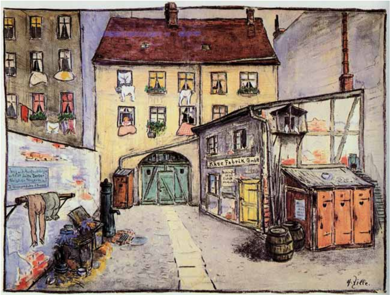
Gemälde eines Berliner Hinterhofs von Heinrich Zille.

seiner Bitte und verstößt Christian. Bei der Premiere offenbart sie jedoch ihre Liebe vor dem gesamten Publikum. Der Mordanschlag auf Christian schlägt zwar fehl, doch Satine stirbt in seinen Armen an ihrer Krankheit.